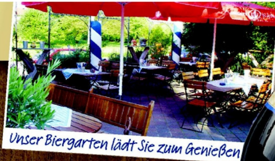
Unser Biergarten lädt Sie zum Genießen

Lerchenberger Str. 2 83527 Haag Tel: 08072/2965